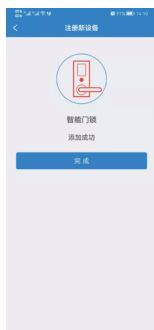
10.等待门锁自动连接成功