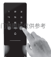
5. 在门锁上操作，依次输入*和#，进入系统设置