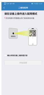
4. 操作门锁进入配网模式