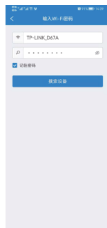
9.输入WiFi密码, 连接设备