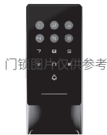
6. 验证管理员信息，按#键结束（初始密码为123456，初始化状态需要重置密码后使用）