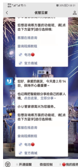
2.点击公众号下方 “微信控制”