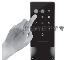
6.输入2进入无线功能，先按2删除无线设备，再按1配对无线设备，门锁提示“无线配对中”