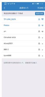
8.选择使用的WiFi热点 (不能使用5G网络热点)