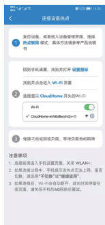
7.在手机上操作, 连接CloudHome的WiFi