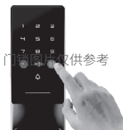
4.在门锁上操作，依次输入*和#，进入系统设置