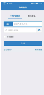
4.进入登录界面，点击 右下角账号注册