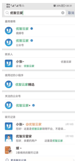
1.微信搜索“优智云家” 进入公众号